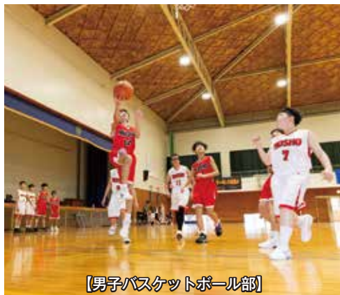
【男子バスケットボール部】